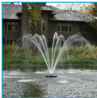
B - Cypress, 1HP