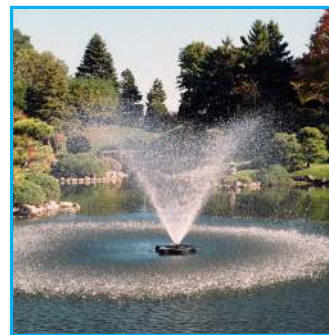
C - Willow, 2HP