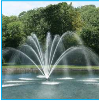
I - Magnolia, 3HP

Las boquillas Premium aumentan el esplendor y belleza a los patrones ya incluidos. Pueden ser adquiridas separadamente y le permite a usted definir su experiencia al seleccionar la boquilla Premium a su gusto. Cada boquilla simplemente encaja en la fuente y se mantiene en su lugar con 3 tornillos.