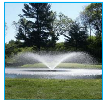
D - Juniper, 2HP