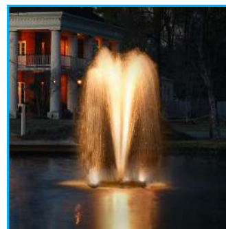
G - Sequoia, 3/4HP