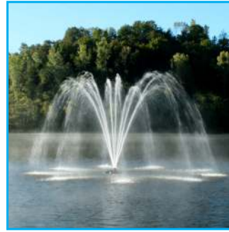
K - Palm, 3HP