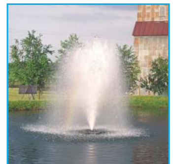
H - Birch, 2HP