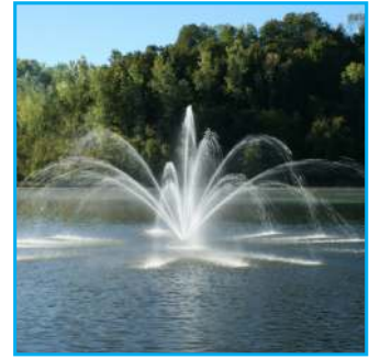
L - Mahogany, 3HP