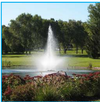
A - Linden, 3HP