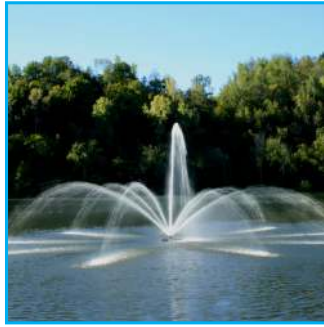
J - Madrone, 3HP